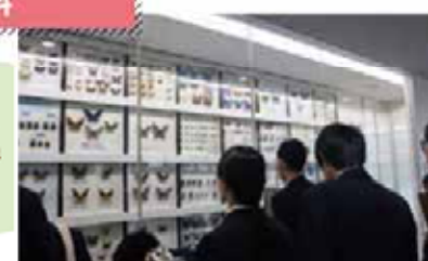
東海大学・昆虫標本の見学