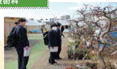
植木市の見学(白川河川敷)