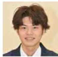
平金煌心 鹿央営農センター

・山鹿市 ・組合員の皆様に信頼される職員を目指します。 ①引っこ込み思案で読書ばかりでした ②反抗期に突入している息子の寝顔をそと見ているとき ⑤共済の知識を深め、組合員の皆様に寄り添えるLAになります