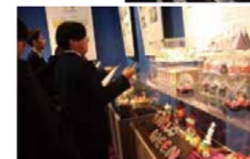
アートキャンディ見学