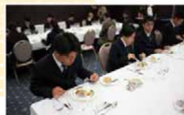
テーブルマナー講習会