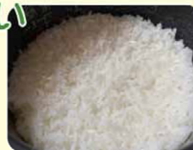
世界的に健康食として注目されるご飯

しかしながら、同じ糖質でもご飯に含まれるでんぷんは砂糖やブドウ糖とは大違い。砂糖やブドウ糖は胃で消化されずに小腸で急速に吸収されて血糖値が急上昇してしまう一方で、でんぷんは消化に時間がかかり、血糖値の上昇が緩やかです。さらに、ご飯はでんぷんだけではなく、タンパク質や脂質、ビタミン、ミネラル、食物繊維などをバランス良く含んでいます。ご飯が太りやすいというのは誤解です。タンパク質やビタミンなどには良いイメージを持って、でんぷんにはネガティブなイメージを抱く人も多いのではないのでしょうか。しかし、私たちヒトにとってでんぷんは重要な栄養素です。ヒトは唾液に含まれるアミラーゼというでんぷん分解酵素の活性が高いといわれています。馬などの草食動物やライオンなどの肉食動物にはアミラーゼ活性はありません。ヒトの中でもでんぷんを多く取る民族である日本人は特に「アミラーゼ遺伝子」が多いといわれています。アミラーゼ活性が高いということは、それだけ体がでんぷんを求めているということ。私たちヒトは長い年月をかけてでんぷんを主体とする食生活によって命をつないできたといえるでしょう。世界にはさまざまなお米があり、その多くは調理に油脂類が使われますが、日本のジャポニカ米は水だけで炊飯することが基本です。ご飯を中心とした和食やおむすびは世界的にも健康的な食事として注目されています。「太るのでは」という心配は捨て、安心してお米の魅力やおいしさを存分にお楽しみください。