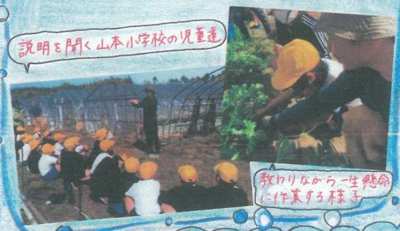
説明を聞く山本小学校の児童達

4月13日に青年部山本支部と田原支部は各地区の小学校の児童達と一糸着にすいかの交配作業を行いました。児童達は野菜部長の話をしっかり聞いて、交配作業を頑張っていました。なかなか雌花に花粉が付かず、苦戦しながらも楽しそくに行っていました。