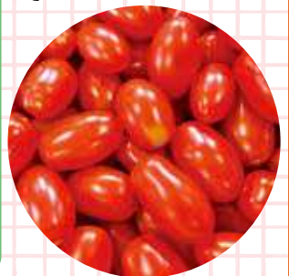
▲アンジェレトマト