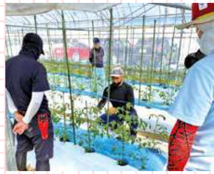
▲営農アドバイザーとして研修生へ技術指導