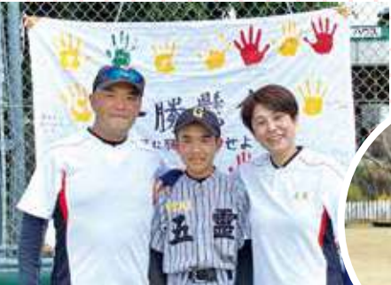
▲野球 長男とはいチーズ！ 次男と野球 パパは塁審！

長男と次男は野球をしていますので、毎週土日は試合の応援です。 親もルールを覚えて審判をするなど大変ですが、楽しみでもあります。 長女は、スイミングやピアノを習っています。妻はラジオのパーソナリティの仕事をして送迎など子育てを頑張ってくれていますので、これからも家族を大切に仕事を頑張りたいと思います。