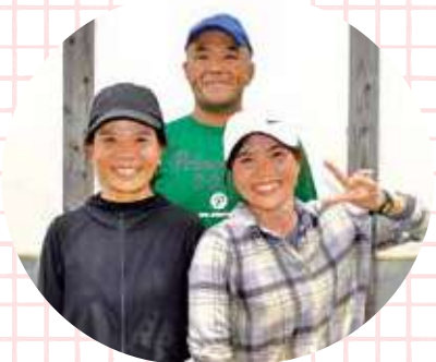
▲外国人技能実習生と一緒に！

水や肥料の量などを調整しながら、病気の発生を抑えて美味しいミニトマトを作ることです。 今年は、畜ふんなど乳酸菌を使用し有機栽培を基本とした土づくりを行っています。 燃油価格や生産資材及び人件費の高騰など経済情勢は厳しい中ですが、色々と試行錯誤しながら品質向上と収量アップにつながるよう技術力向上に努めています。