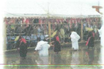
近隣の学生 が苗を植え ている様子