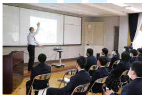
新入生オリエンテーション