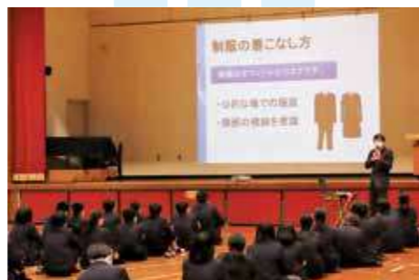
制服着こなし方セミナー