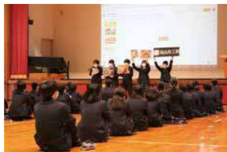
生徒対面式・鹿農集会

本校は令和5年には創立110周年を迎えます。139名の生徒及び54名の教職員が一致団結し「チーム鹿農」として新たな歴史を切り開き、これからも鹿本農高らしい学校行事や地域イベント等に積極的に参画し、地域と共に、地域に根差し、地域に必要とされる学校であり続けるために、迷わず前に前進したいと考えています。今後とも、皆様のより一層のご支援、ご指導を賜りますようよろしくお願いいたします。