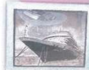
作品名 「クルース船」