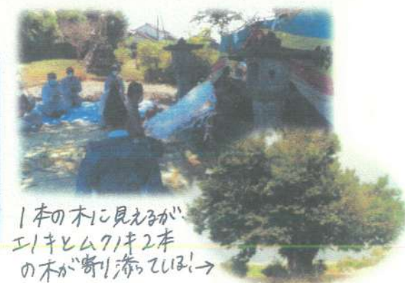
1本の木に見えるが、エキレム71キ2本の木が寄り添ってほしい!

今回は、下分田地区の行事紹介です! 下分田農村公園内に中分田八幡宮の分神でもある「拝高さんの森」があります。毎年10月15日に拝高天神祭が行われ今年も地域の人々が集まり、開催されました。これからも地域のシンボルとして親しまれていきたいと思います。