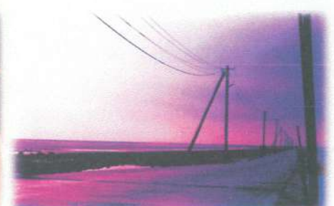
宇土市 長部田 海床路