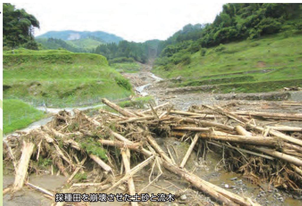
採種田を崩壊させた土砂と流木

今後もグループ一丸となって、被害状況の調査及び被災された方々への支援に尽力してまいります。