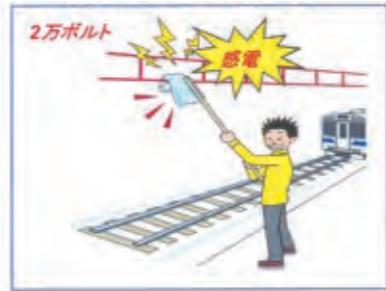
飛来物に触らないで!

新幹線の場合は 電話：092-624-3892 在来線の場合は 電話：092-624-3836