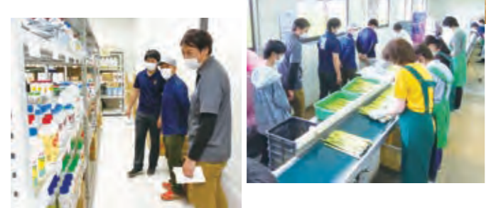
▲営農センターや選果場などを視察しました