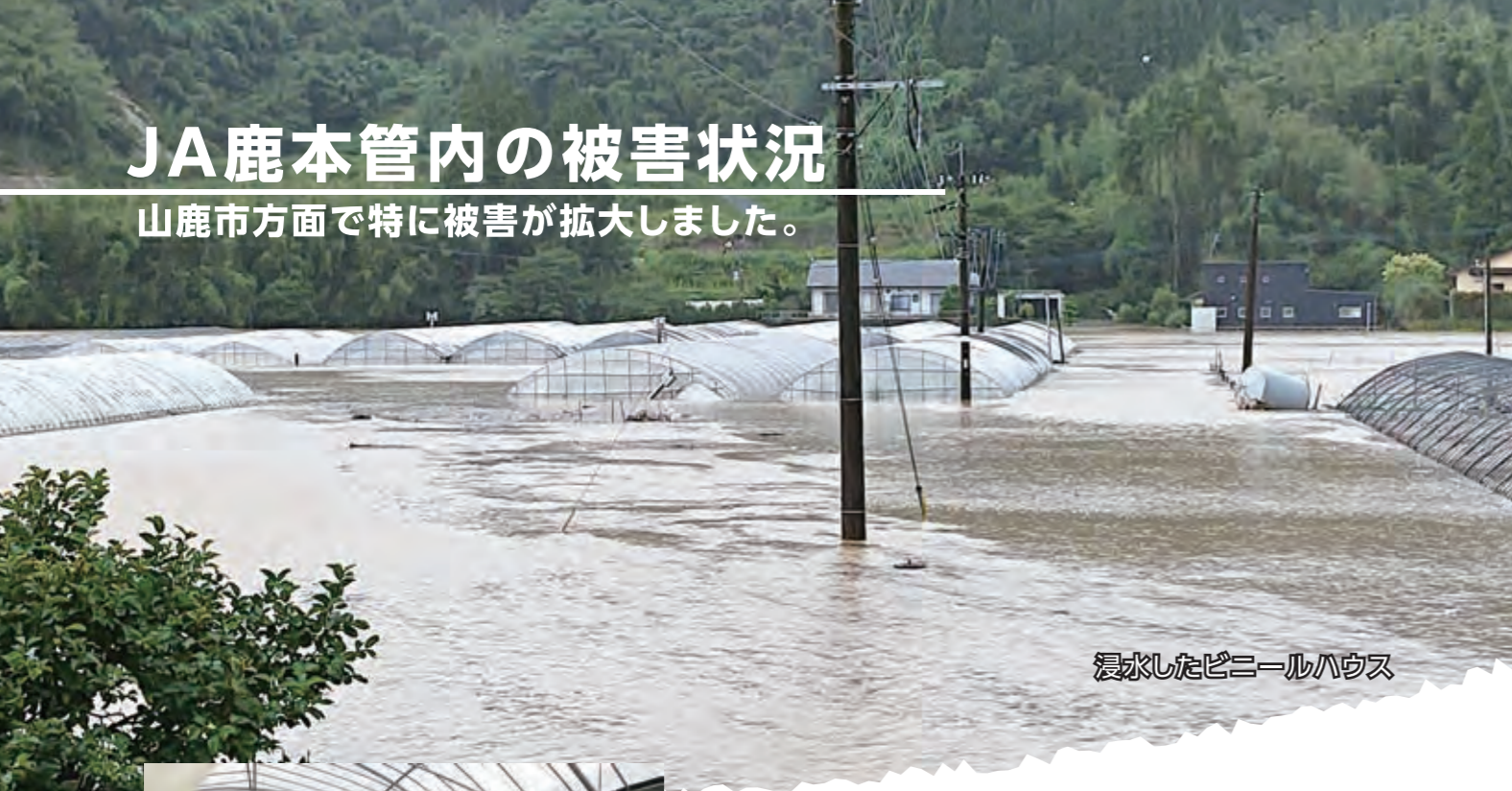
浸水したビニールハウス