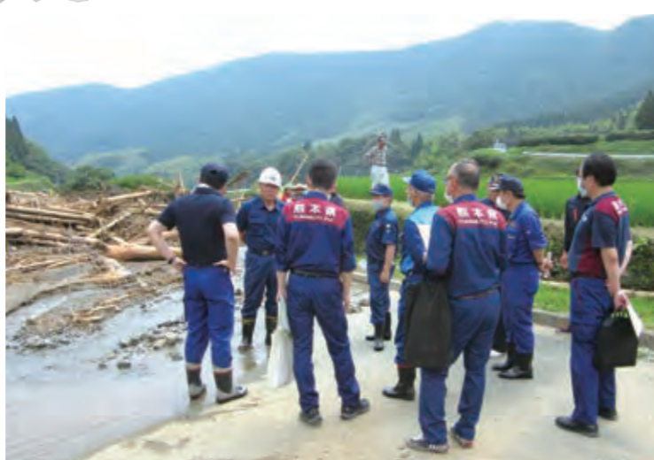
国会議員らに早期の復旧を要請