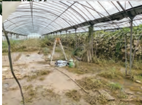
浸水後、水が引いたハウス内