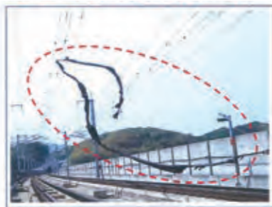
ビニールが列車を止める!

風で飛んだ農業用ビニール等が線路の架線に引っかかり、列車を止めます。農業用ビニールや防鳥テープ、ブルーシート等が飛散しないよう、しっかり固定するなど飛散防止対策をお願い致します。また、感電する恐れがありますので、飛来物を見つけたら触らずに、下記へお電話ください。