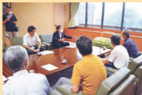
▲熊本市役所で中村賢副市長らへ寄贈