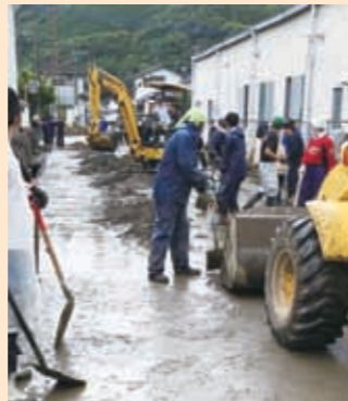
▲道路上に堆積した土砂の撤去

JA鹿本では、特に被害が大きかった県南地区(球磨・芦北・八代)へ、支援隊として延べ36名の職員を派遣。農地に流れ込んだ土砂・流木等の撤去及び農業施設等の復旧にあたっており、改めて被害の大きさを痛感させられました。