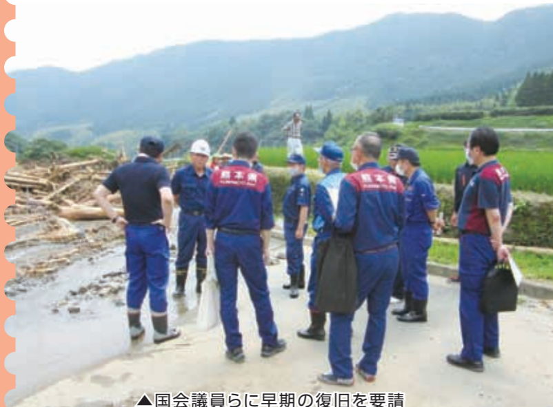
▲国会議員らに早期の復旧を要請

本県JAグループは、被災地域の一刻も早い復旧・復興、農業経営の早期再建へ向け、早急かつ万全の対策を継続的に講じられるよう、予算や資材の確保などを国へ要望しています。