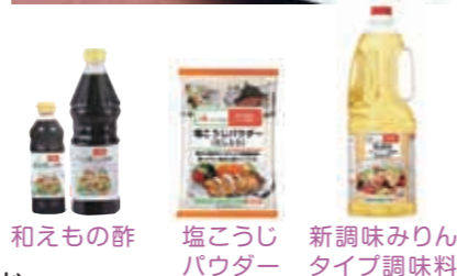
和えもの酢 塩こうじパウダー 新調味みりんタイプ調味料