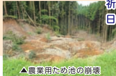
▲農業用ため池の崩壊

JA鹿本では、特に被害が大きかった県南地区(球磨・芦北・八代)へ、支援隊として延べ36名の職員を派遣。農地に流れ込んだ土砂・流木等の撤去及び農業施設等の復旧にあたっており、改めて被害の大きさを痛感させられました。