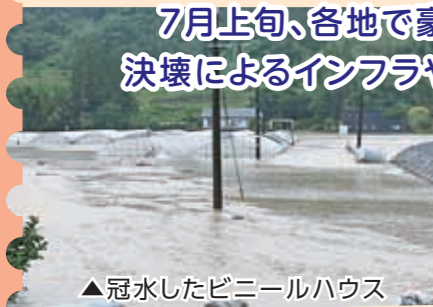
▲冠水したビニールハウス