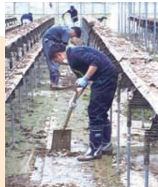
▲ビニールハウス内に流れ込んだ土砂の撤去