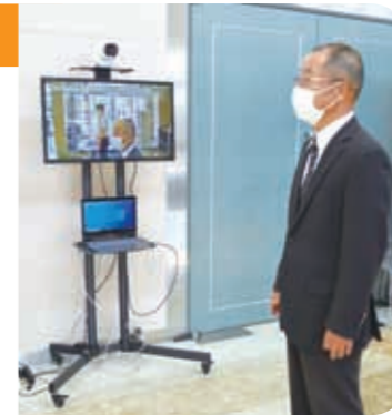
▲天寿苑本館に設置したサーマルカメラ

また、天寿苑本館入口には、自動で複数名の来館者の体温を測定する機器「体表面温度測定サーマルカメラ」を設置し、来館者の体調管理に活かしています。