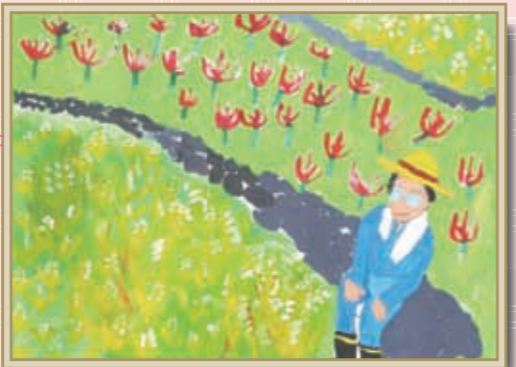
『お米畑の様子』 みもりりくや 三森陸矢くん (山鹿小4年)