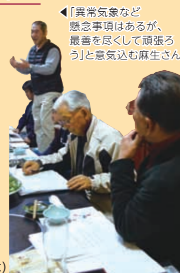
◀「異常気象など懸念事項はあるが、最善を尽くして頑張ろう」と意気込む麻生さん