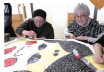
大きな福を作成中!