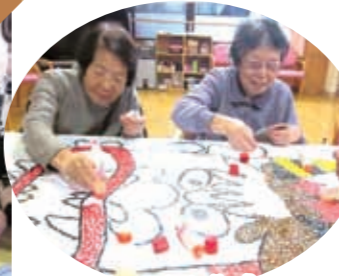
こわーい鬼も作成中?