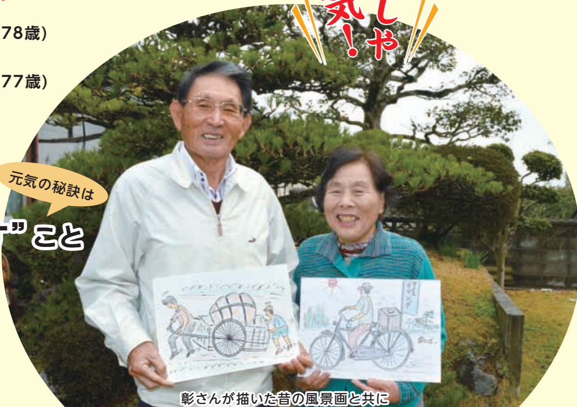
彰さんが描いた昔の風景画と共に