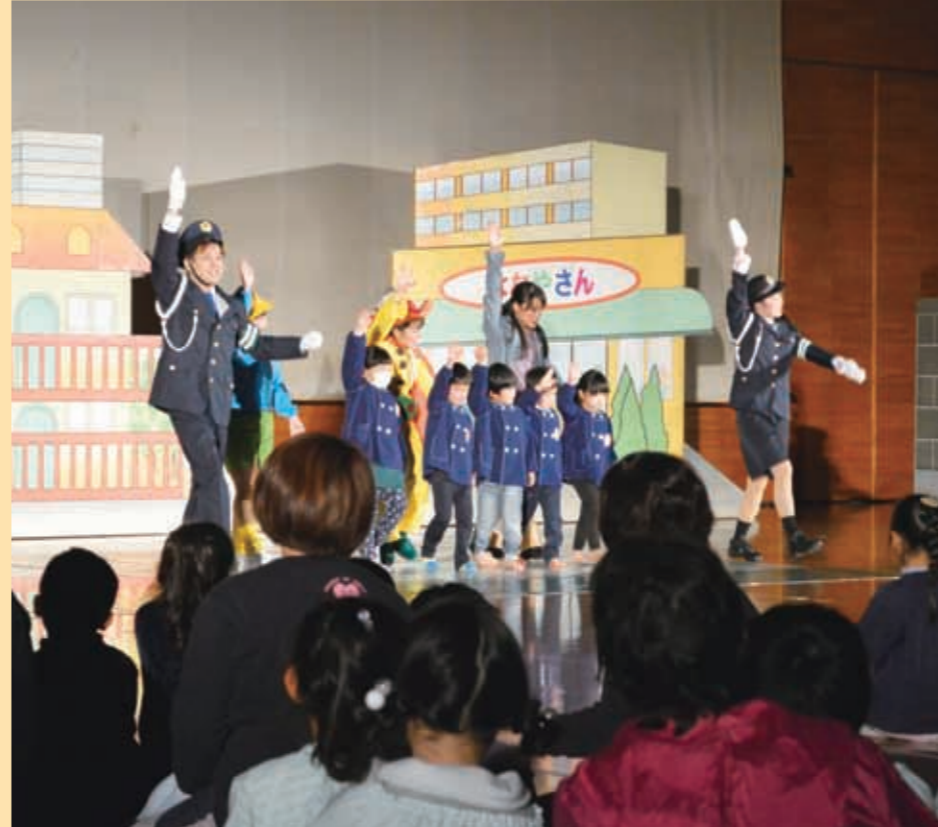
▲ミュージカルに参加し、横断歩道の渡り方を学ぶJA管内の園児たち

JA鹿本とJA共済連熊本が主催となり、親と子の交通安全ミュージカル『魔法園児マモルワタル』を1月23日、山鹿市カルチャースポーツセンターで開催した。 同ミュージカルは、魔法界のやんちゃな園児マモルワタルくんが、修行に出された人間界で警察官から交通ルールを学ぶ物語。JA管内の保育園児や保護者など約400人が観賞し、横断歩道の正しい渡り方を実際に体験しながら学んだ。