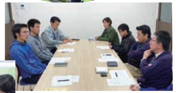
▲山鹿地区営農指導員と、同地区へ就農予定の研修生が情報交換をしました。