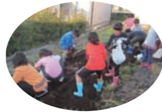
学童保育との定期的な活動

JA鹿本は各事業を通じ、 創造的自己改革の実現に向けて取り組みます！ 次月号に続く▶▶▶