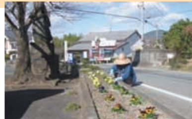
老人会の方々との花いっぱい運動

「夢さくら」では、半年に1回の「夢さくら」運営推進会議を開催し、三玉地域の区長さんをはじめ代表者の方々と今後の運営に関しての意見交換を実施しています。その他、三玉地域の行事への参加や学童保育との定期的な活動を行っています。