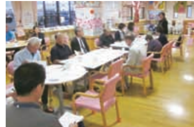
半年に1回の運営推進会議の開催