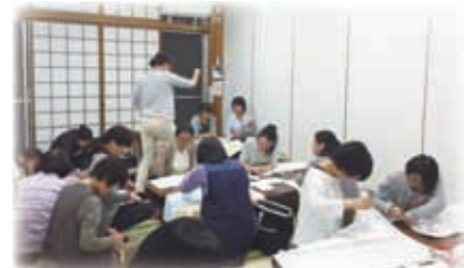
植木支部小学校 保護者と防災頭巾作り