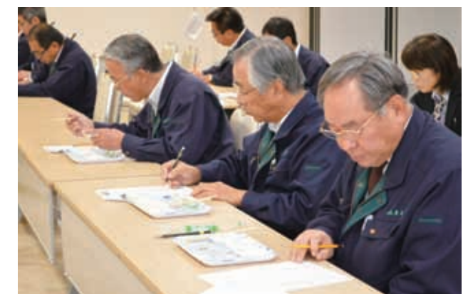
▲これぞ!!一番米コンクール食味審査

カントリーエレベーターなどの共同乾燥施設および米検査場への持込に対し、集荷数量にあわせて1俵あたり50円または100円を助成しています。