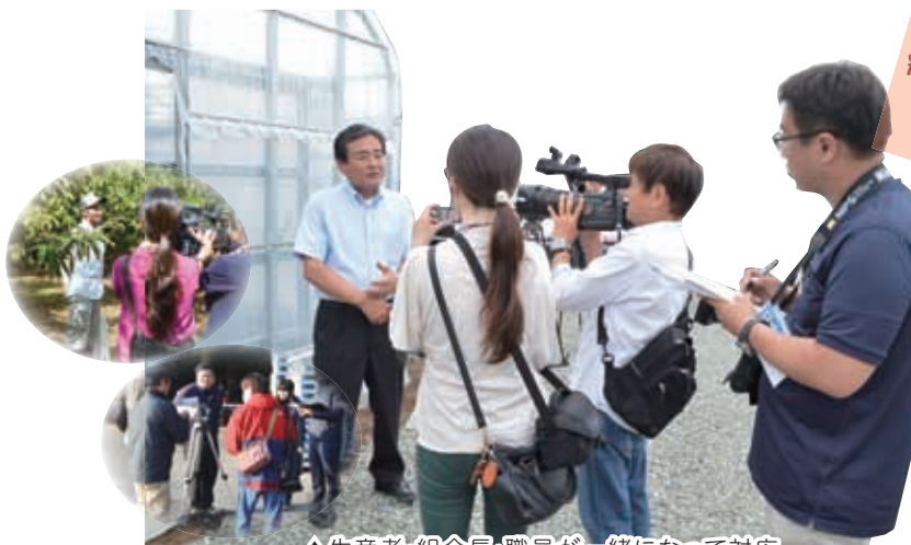
▲生産者・組合長・職員が一緒になって対応