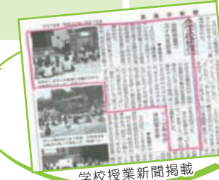
学校授業新聞掲載